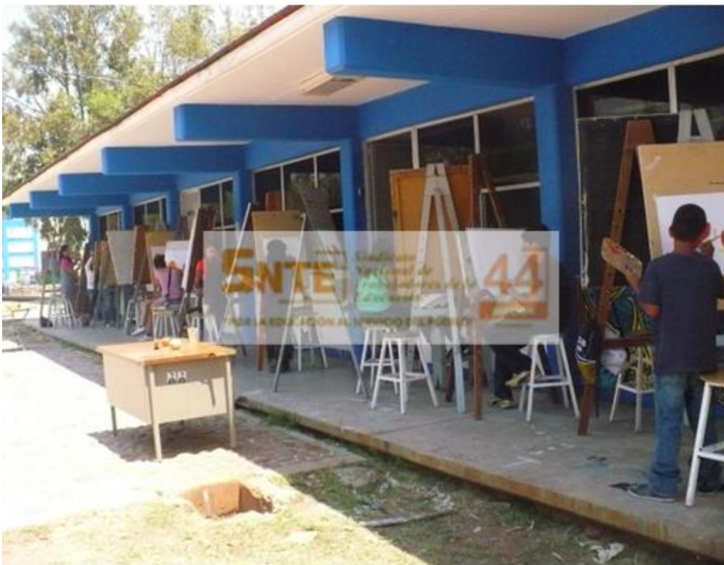
Evidencia del trabajo de alumnos en las antiguas instalaciones del Museo Guillermo Ceniceros en la ciudad de Durango, Durango lugar donde fueron atendidos antes de hacer convenio con la UJED.