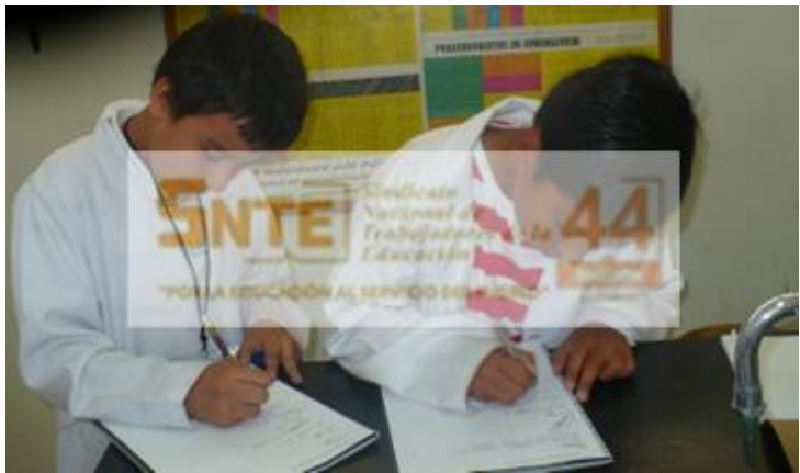
Evidencia del trabajo de alumnos AS en la Escuela de Pintura, Escultura y Artesanías de la UJED.