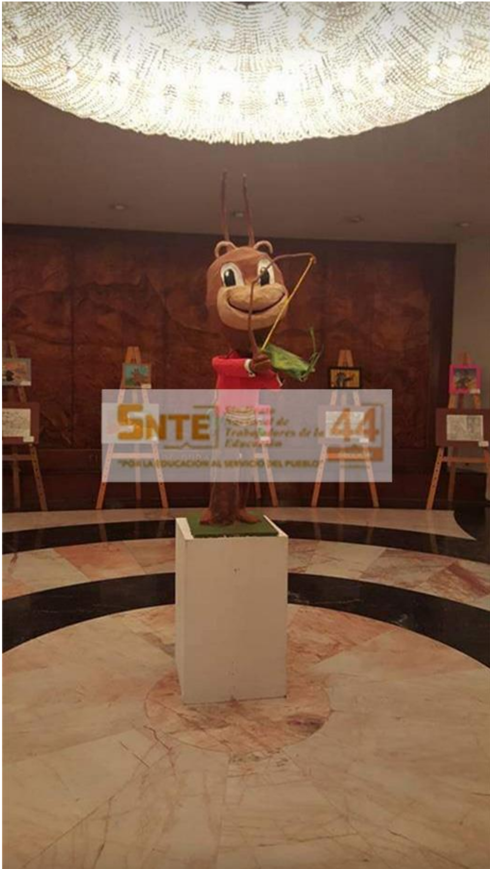
Evidencia del trabajo de alumnos AS en la Facultad de Ciencias Químicas de la UJED.